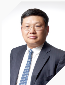
长江商学院创办院长 中国商业与全球化教授 项兵

希望我们培养的企业家学员们，在考虑商业决策的时候，也会考虑人类未来真正的长远利益，从而由富足的生活走向丰盈的人生，为中国乃至全球的经济、社会、环境的可持续发展和包容性增长贡献长江人的一份力量。构建责任共识！